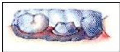
Moulage de la provisoire