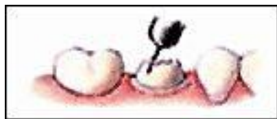
Taille de la dent

La dent provisoire est ensuite mise en place en attendant que le prothésiste réalise la prothèse définitive.