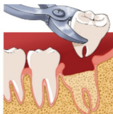
Extraction de la dent de sagesse