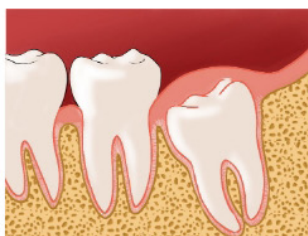
Eruption de la dent de sagesse

— “Si la dent de sagesse a trouvé sa place sur la mâchoire et qu'elle peut être correctement nettoyée, il n'y a pas lieu d'intervenir.”