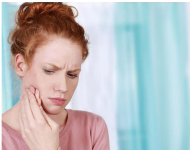
Après l'extraction de vos dents de sagesse, il est courant de subir une certaine gêne au niveau de la bouche.