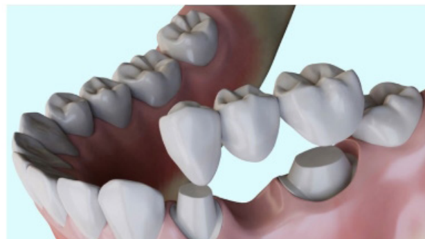
Les dents qui bordent la dent manquante sont préparées pour recevoir le bridge.

— “ Les éléments du bridge peuvent être métalliques, céramo-métalliques ou tout céramique. ”