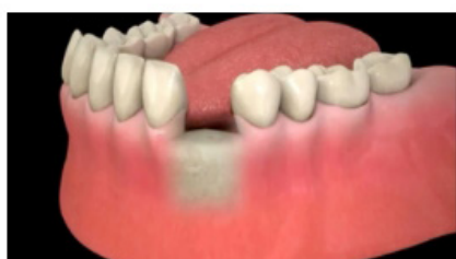
Accès au site

— “ L’intervention est réalisée sous anesthésie locale et dans de parfaites conditions d’asepsie. ”