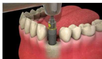
Mise en place de l'implant