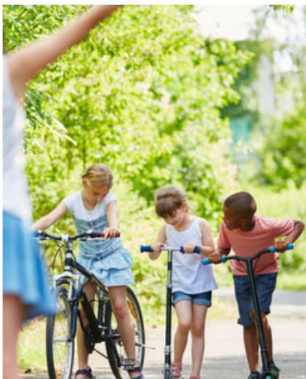
Chutes de vélo, trottinette, jeux en plein air, dans la cour de récréation... Les jeunes enfants sont les plus exposés au traumatismes dentaires.